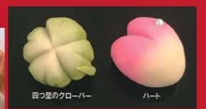
四つ葉のクローバー